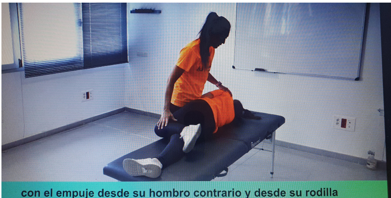
con el empuje desde su hombro contrario y desde su rodilla